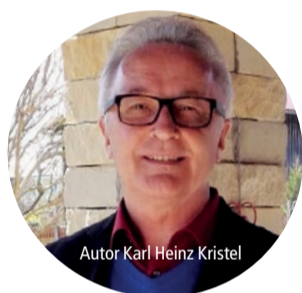
Autor Karl Heinz Kristel

Eintritt frei Um eine Spende für den Ambulanten Hospiz- und Palliativberatungsdienst wird gebeten.