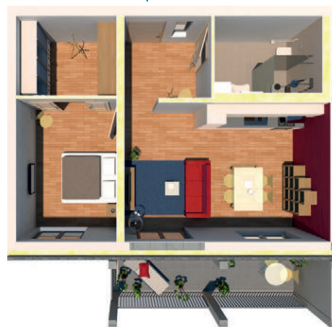
Abbildungen beispielhaft, unverbindlich und nicht detailgetreu. Wohnungen unmobiliert.